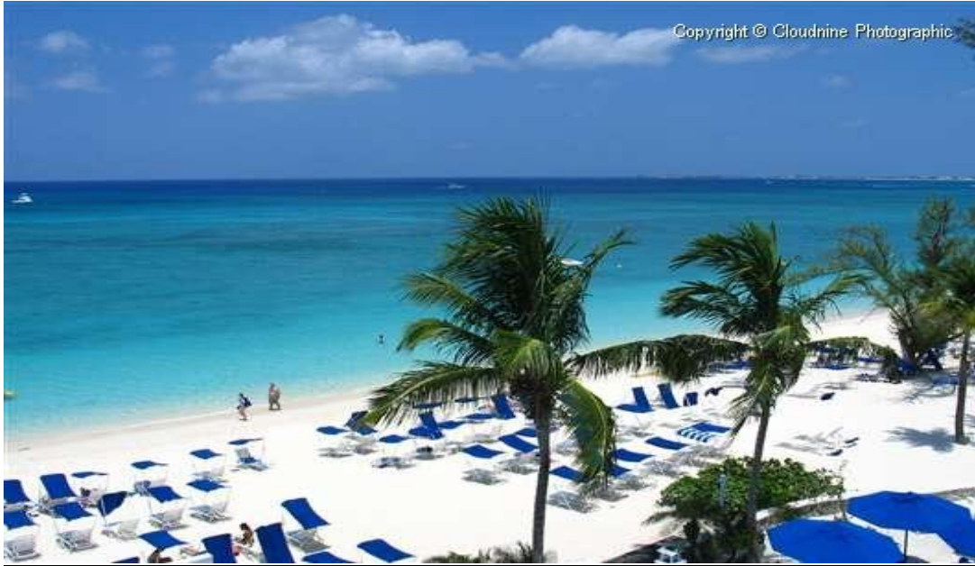
Plaja del Carmen Mexic