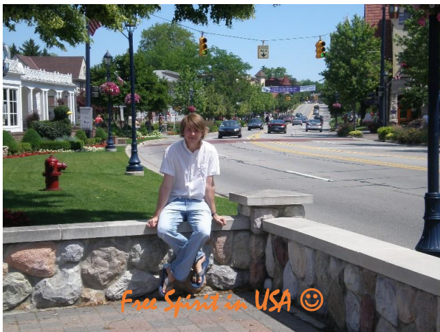
Free Spirit in USA ☺