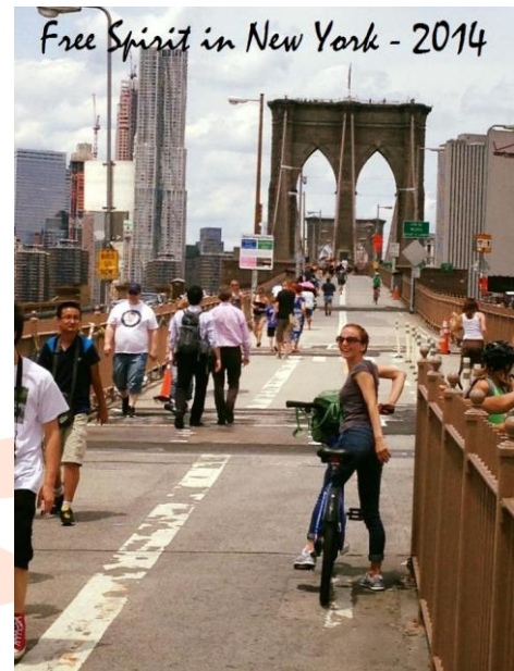
Free Spirit in New York - 2014