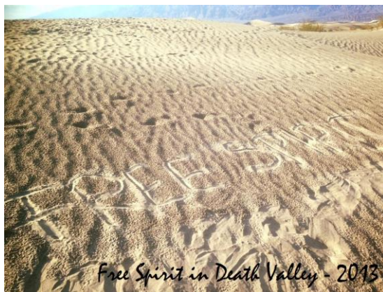
Free Spirit in Death Valley - 2013