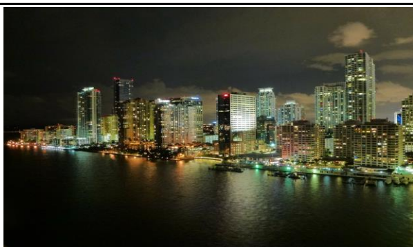
Ești în Miami, extravagantă, lux, exotic !

Ai 1000 de motive să-ți continui călătoria în Miami și Croazieră în Caraibe!