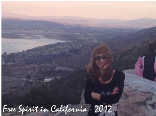
Free Spirit in California - 2012

Str. Dâmbovicioarei nr. 17, ap. 1, sector 2, București www.free-spirit.ro, office@free-spirit.ro, t. 0728 001 111